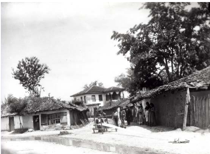
(Прилог 2. Улица у Нишу, припрема потке за ткање, 1890. године)