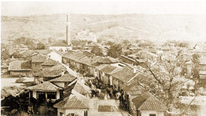
(Прилог 1. Ниш после ослобођења 1878. године)